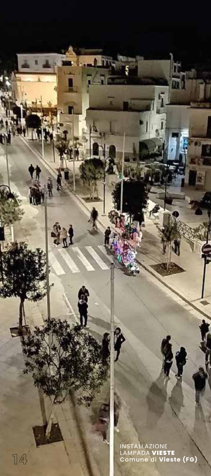
INSTALLAZIONE LAMPADA VIESTE Comune di Vieste (FG)