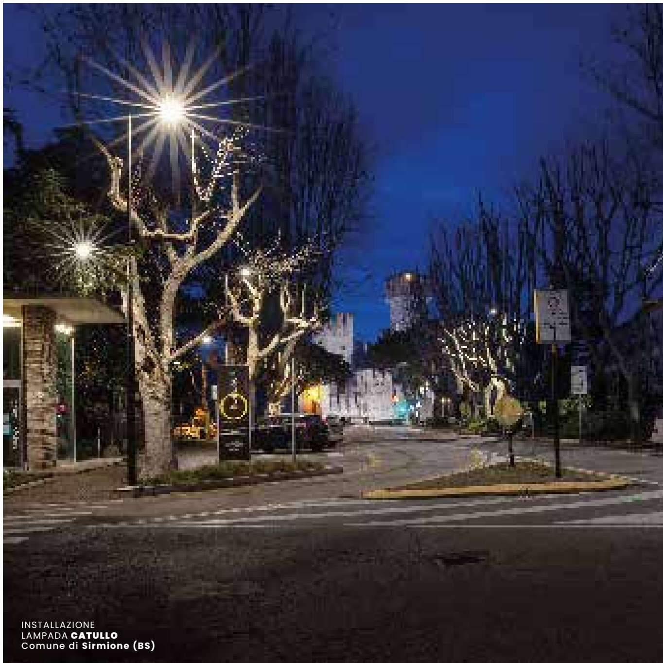
INSTALLAZIONE LAMPADA CATULLO Comune di Sirmione (BS)